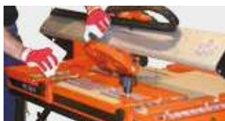
TÊTE INCLINABLE (0 À 45°)