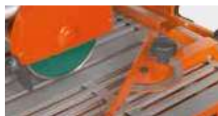
GUIDE DE COUPE AVEC RÉGLAGE DE L'ANGLE