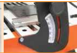
Tête inclinable (0 à 45°)