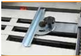
Guide de coupe