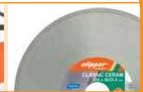
Machine livrée avec un disque diamant Clipper CLASSIC CERAM Ø200mm