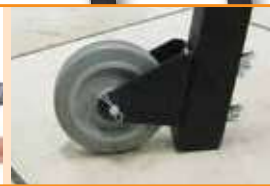
Roues de transport