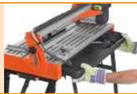
Bac à eau amovible