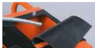
RÉSÉROIR D'EAU INTÉGRÉ