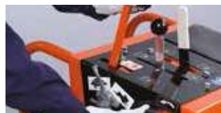
COMMANDE MANUELLE OU HYDRAULIQUE ANNEAU DE LEVAGE INTÉGRÉ DE MONTÉE ET DESCENTE DU DISQUE