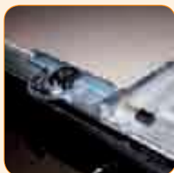
Einfach zu befestigender Schnittanzeiger