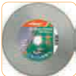
CLASSIC CERAM Ø 200 x 25,4mm