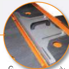
Guide de coupe latéral.