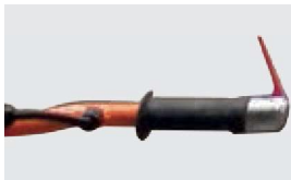
TOTMANSCHALTER FÜR MEHR SICHERHEIT