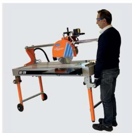
LEICHTER TRANSPORT DANK EINKLAPPBARER FÜÙE UND TRANSPORTRÄDER.