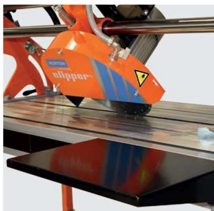
AUFLAGETISCH IM LIEFERUMFANG ENTHALTEN