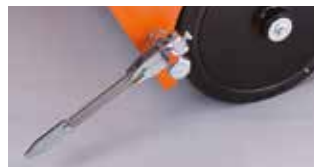
GUIDE DE COUPE ARRIÈRE FLEXIBLE