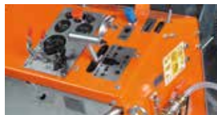
TABLEAU DE BORD INTUITIF