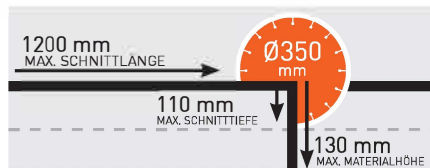
MAX. SCHNITTtiefe - CST 120