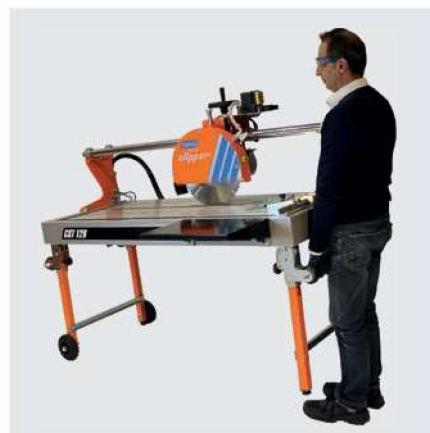
LEICHTER TRANSPORT DANK EINKLAPPBARER FÜÙE UND TRANSPORTRÄDER.