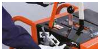
COMMANDE MANUELLE OU HYDRAULIQUE DE MONTÉE ET DESCENTE DU DISQUE