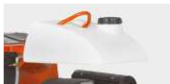
RÉSERVOIR D'EAU ( ACCESSOIRE OPTIONNEL)