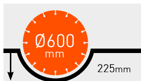
PROFONDEUR DE COUPE MAXI.