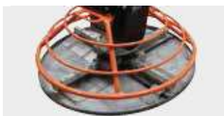
ANNEAUX DE PROTECTION DES PALES