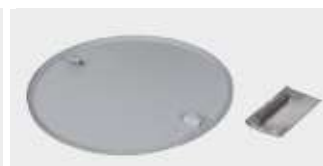
VENDUE AVEC PALES DE FINITION ET PLATEAU