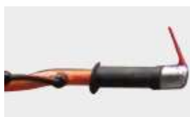
POIGNÉE HOMME-MORT POUR LA SÉCURITÉ