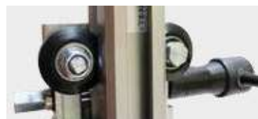
CHARIOT GUIDÉ PAR ROULEAUX