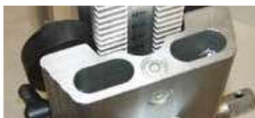
NIVEAU À BULLE.