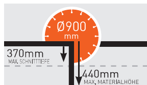
MAX. SCHNITTITIEFE - JUMBO 900