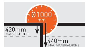
MAX. SCHNITTITIEFE - JUMBO 1000