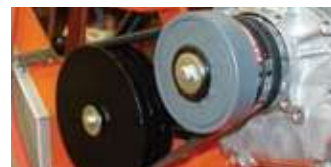
FLIEHKRAFTKUPPLUNG (NUR JUMBO MIT BENZINMOTOR)