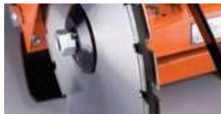
DOPPELBLATTMONTAGE (NUR CS 451E)