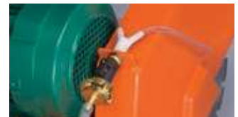
ANSCHLUSSMÖGLICHKEIT FÜR EXTERNE WASSERZUFÜHRUNG (NUR CS451 E)

WIR EMPFEHLEN DEN EINSATZ FOLGENDER DIAMANTSCHLEIBE FÜR CS451 E & ET