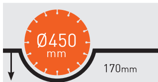
MAX. SCHNITTIEFE CS451 E