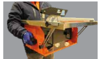
LEICHT ZU TRANSPORTIEREN