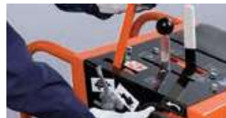
MANUELLER ODER HANDHYDRAULISCHER VORSCHUB.