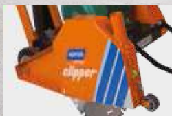
CS451 CARTER DE PROTECTION