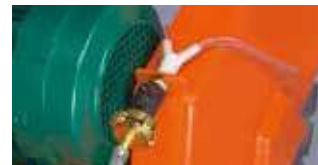
CONNECTEUR POUR FLEXIBLE D'EAU (CS451 E UNIQUEMENT)