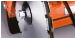
MONTAGE DE DEUX DISQUES EN PARALLÈLE (CS451 E UNIQUEMENT)