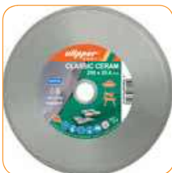
CLASSIC CERAM Ø 200 x 25,4 mm