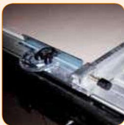
Blocage rapide et précis du guide de coupe.