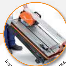
Transport et rangement faciles.