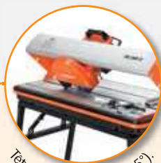
Tête inclinable (0° to 45°).