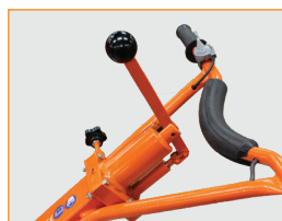
HYDRAULISCHES EINSTELLEN DER FLÜGEL