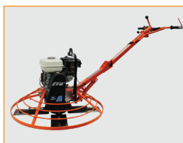
ROBUST UND VERLÄSSLICH