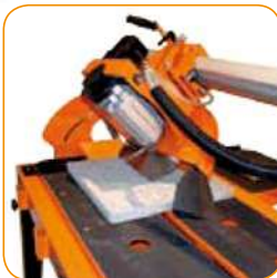
Führungsschiene und Kopf schwenkbar.