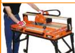
Guide de coupe avec réglage de l'angle

TR230GS est une puissante scie de carrelage équipée d'un puissant moteur (1,1 kW) permettant une longueur de coupe adaptée à des carrelages longs (860mm).