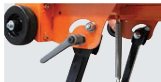
KLAPPBARE UND FESTSTELLBARE FÜÙE