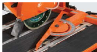
SCHNITTFÜHRUNG MIT WINKLEINSTELLUNG / ANTIRUTSCHBESCHICHTUNG