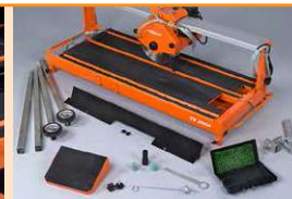
Übersicht Zubehörteile (optional)