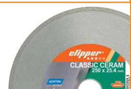
Im Lieferumfang ist eine Diamantscheibe Clipper Classic Ceram Ø 250 mm enthalten