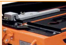
Anschlag im Lieferumfang enthalten