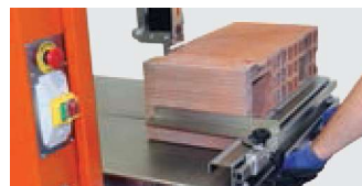
SICHER IN DER ANWENDUNG