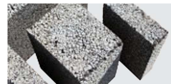
PRÄZISIONSSCHNITTE FÜR ALLE ANWENDUNGEN