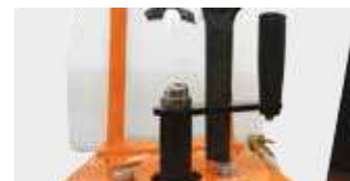
SYSTEME DE BLOCAGE DE LA PROFONDEUR DE COUPE