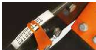
INDICATEUR DE PROFONDEUR DE COUPE