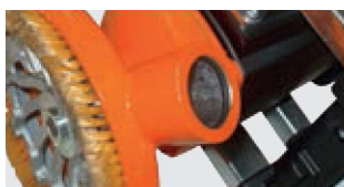
ANSCHLUSSMÖGLICHKEIT FÜR FILTERANLAGE