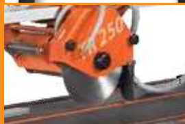
Tête de coupe plongeante

La nouvelle Clipper TR250 H est une machine robuste et de grande qualité complétant parfaitement notre gamme de scies de carrelage. Sa longueur de coupe maximale atteint 1000mm.