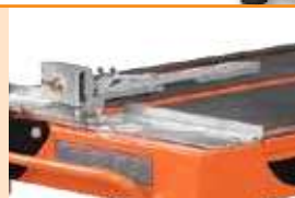
Guide de coupe intégré