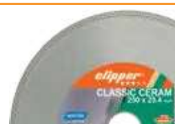
Machine livrée avec un disque diamant Clipper CLASSIC CERAM Ø250mm